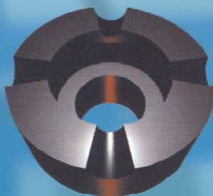
Speciální hvězdičce pro dlouhé brikety