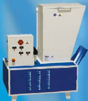
MAC 300 SUPER max. výkon 100 kg/hod