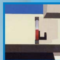
Hlídkání hladiny oleje