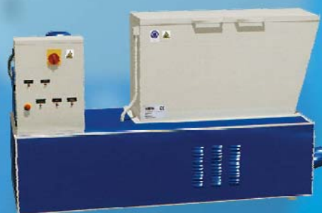
MAC 1000 SUPER max. výkon 400 kg/hod