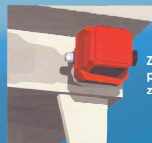
Zařízení proti zamrznutí