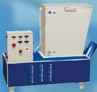
MAC 600 SUPER max. výkon 200 kg/hod